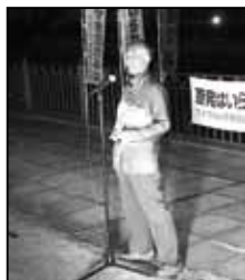
●久しぶりの参加です。衆議院が解散して、これから何百億