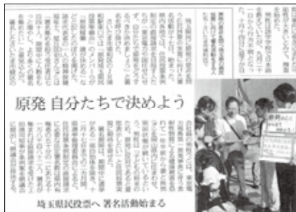
署名活動の開始を伝える新聞紙面 （「東京新聞」2014.10.18 朝刊）