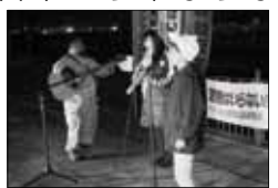
●川を越えた東越谷から来ました。原発は人間の自由にはならないもので、一日も早くなくしたほうがいい。

●この間「原発県民投票を実現するための準備の署名を集める会」の中間報告会に行ってきました。すごく楽しかったです。なんと、うか、この署名自体は原発に反対するための署名ではなくて「原発賛成・反対」という自分たちで意思表示ができること、それを実現する県民投票をするための条例を作ろうという署名活動なんです。なんかすごくフリーで、いろんな方が署名できる。「反対」っていつかしてやるのではなくて、自分たちの権利として、自由にこれから作っていくんだよ……という活動だと思っています。